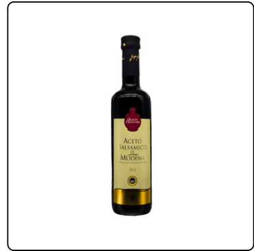
VINAGRE BALSÁMICO DI MODENA 500 ML