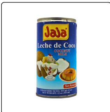
LECHE DE COCO JAJÁ LATA 12 OZ.