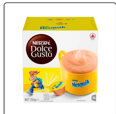
DOLCE GUSTO NESQUIK 16 CÁPSULAS