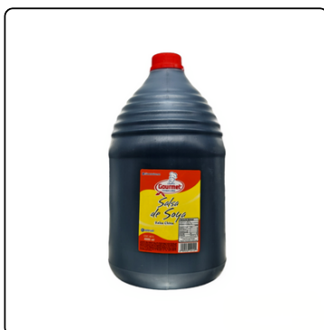
SALSA DE SOYA 5 OZ MC. CORMICK