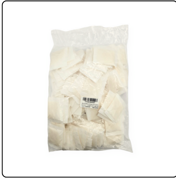
AZÚCAR SOBRES BLANCA S/LOGO 16X150 UND