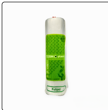
POLIPEL ROLLO 500 HOJAS