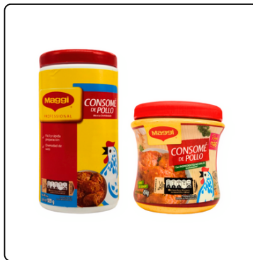
CONSOMÉ DE POLLO MAGGI BOTE 920 GRS./ 12X454G XP