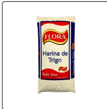
HARINA TODO USO 4.4 LBS FLORA BOLSA