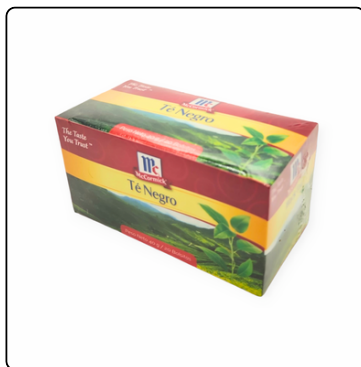
TÉ NEGRO CAJA 48X20 UNIDADES MC CORMICK