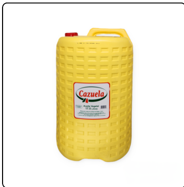
ACEITE VEGETAL CAZUELA 17.5 LITROS