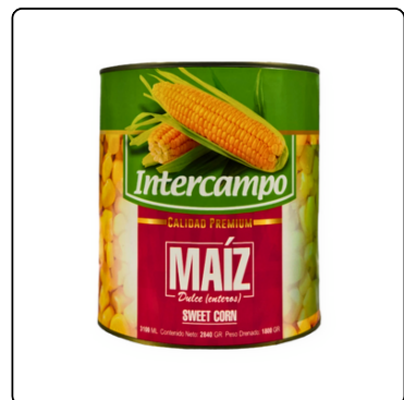
MAÍZ DULCE/SWEET CORN 2840GX6 INTERCAMPO