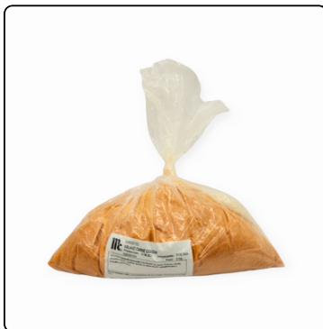
ABLANDADOR CON SAZÓN MC. 2 KG.BOLSA