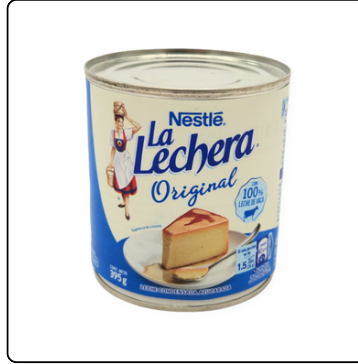
LECHE CONDENSADA LA LECHERA LATA 48X395GR