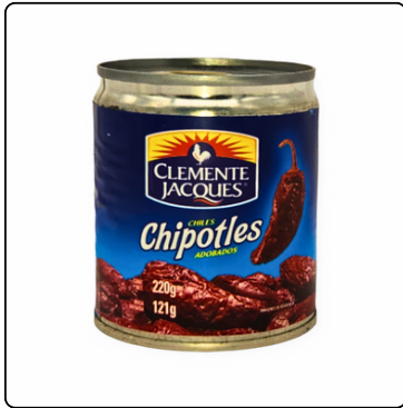
CHILE CHIPOTLE LATA 24/220 GRAMOS