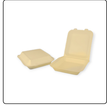
BANDEJA LISA 2P TERMO 1X10X50 UN