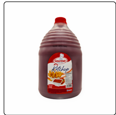
SALSA KETCHUP GOURMET GALÓN BOTE