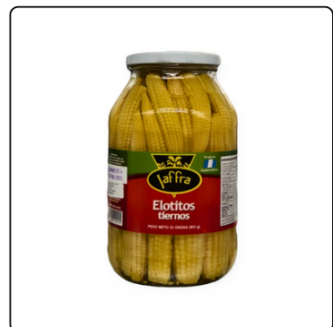
ELOTITOS TIERNOS JAFFRA BOTE 12*32 OZ