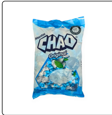
DULCES DE MENTA CHAO 24/100 UN