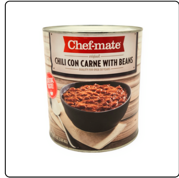
CHILI BEANS GALÓN CHEF MATE LATAS