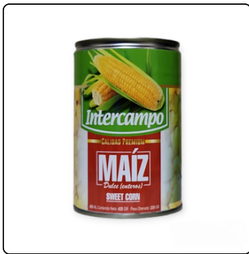
MAIZ DULCE / SWEET INTERCAMPO 15 ONZAS