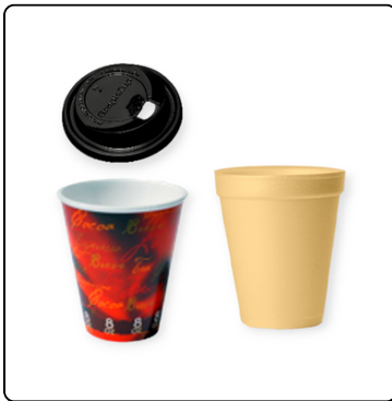
TAPADERA/VASO GENERICO #8 NEGRA/VASO TERMICO #8