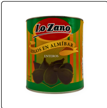
HIGOS EN ALMÍBAR LOZANO GALÓN