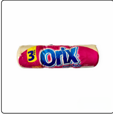
JABON PARA LAVAR ORIX PAQ. 3 UNIDADES