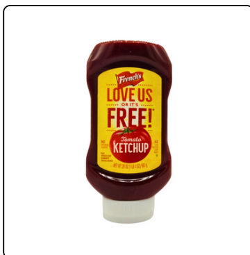
SALSA KETCHUP FRENCHS BOTE 12*20 OZ.