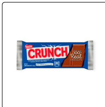
CRUNCH CHOCOLATE CON LECHE 43.9G