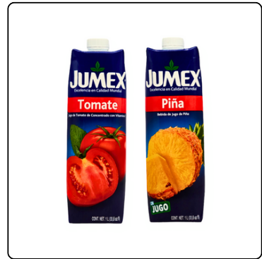
JUGO DE TOMATE/PIÑA JUMEX 1 LITRO