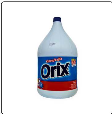
LEJÍA ORIX GALON