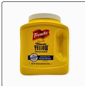
MOSTAZA FRENCHS GL. 4*105 OZ.