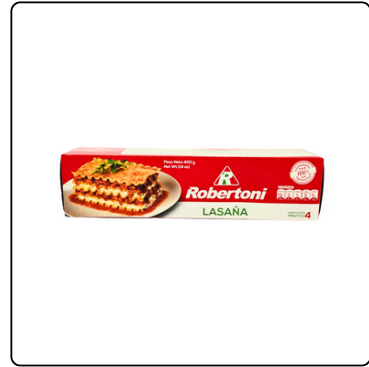
LASAGNA ROBERTONI 24/400 GRS