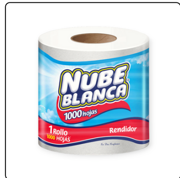
TOALLA COCINA NUBE BLANCA 1 ROLLO 1000H