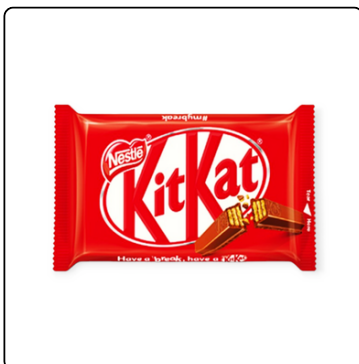
KIT KAT 4 FINGER (24X41.5G)