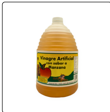
VINAGRE DE MANZANA GALON DE LA ABUELITA