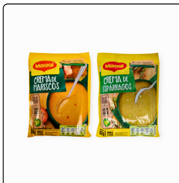
CREMA MARISCOS 12X80 GRS CREMA ESPÁRRAGOS 66 GRS.