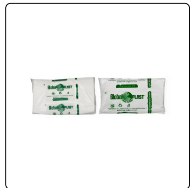
GABACHA BLANCA NO1/NO3 100 UNIDADES