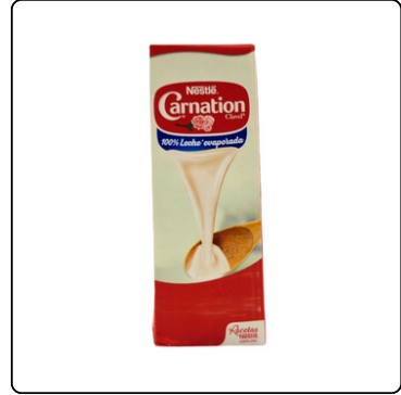
LECHE EVAPORADA CARNATION 12X1 LT