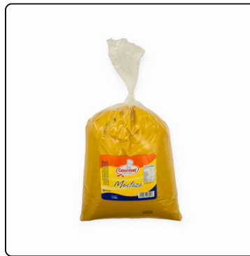
MOSTAZA GOURMET BOLSA GALÓN