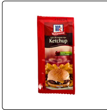
KETCHUP MC. CORMICK PORTION PACK 1000X8G