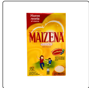
MAIZENA CAJITA 375 GRS