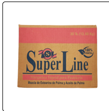
MARGARINA SUPER LINE GRANEL 30 LBS.