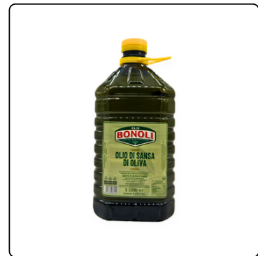
ACEITE DE OLIVA 5 LT BONOLI