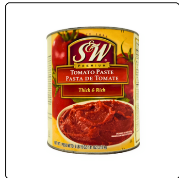
PASTA DE TOMATE SW LATA GALON