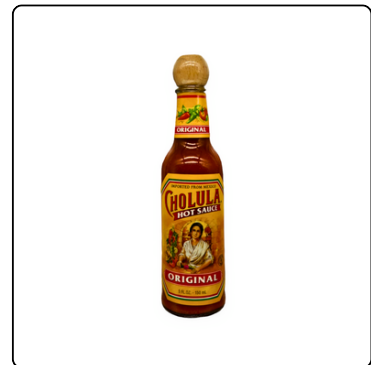
CHOLULA HOT SAUCE ORIGINAL