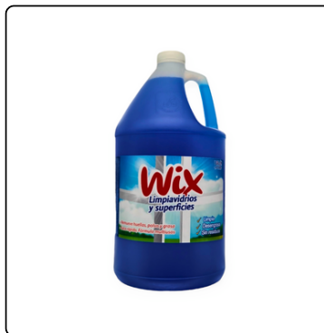
LIMPIA VIDRIOS SAINT GERMAIN GALON