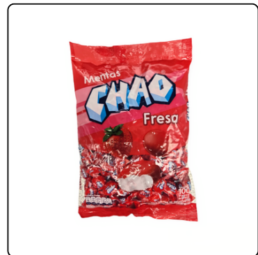
DULCES MENTA CHAO FRESA 24/100 UN