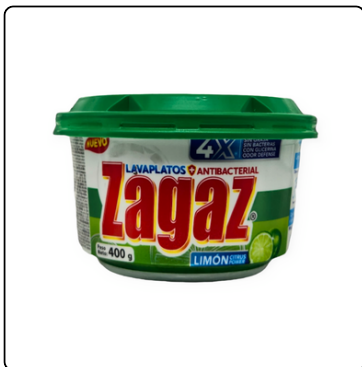
JABÓN LAVAPLATOS CITRUS ZAGAS 16X425GR