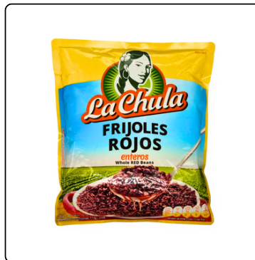
FRIJOLES ROJOS ENTEROS LA CHULA (6/4 LB.)