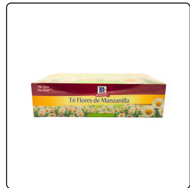
TÉ DE MANZANILLA MC. CORMICK 1(12X100 UN)