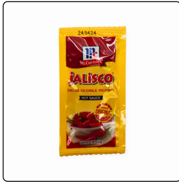
CHILE JALISCO SOBRES MC. CORMICK 500/5G