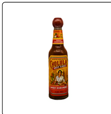
CHOLULA HOT SAUCE SWEET HABANERO