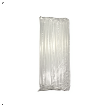
PAJILLAS FORRADAS PARA FROZEN 50/25 UNI.