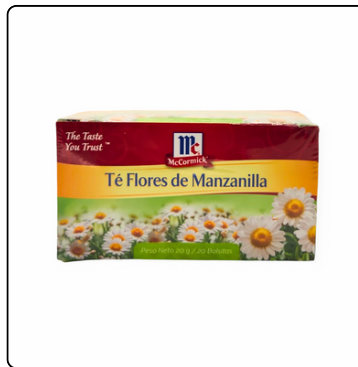
TÉ DE MANZANILLA 48X20X1 GRS MC CORMICK