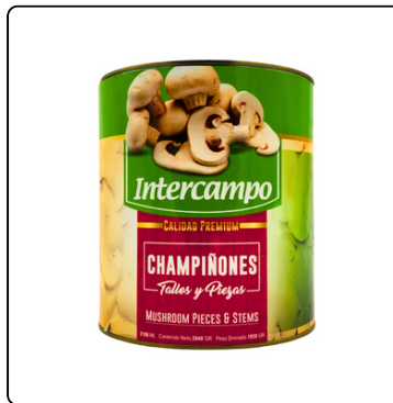
HONGOS REBANADOS INTERCAMPO GLN