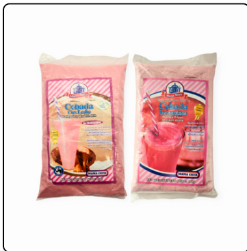
CEBADA C LECHE/NATURAL EN POLVO 1 LIBRA