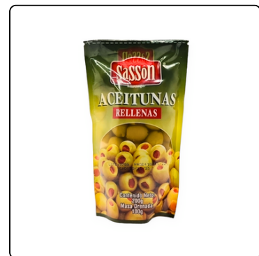
ACEITUNA VERDE CON PIMIENTO 20/200GRS