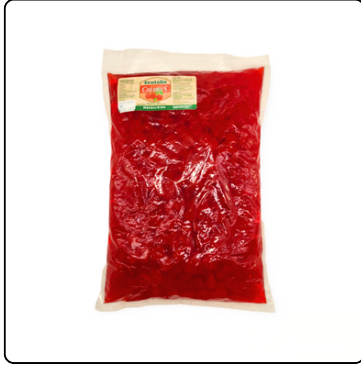
CHERRIES MITADES BOLSA 5.5 LBS FRUTALIA