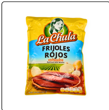
FRIJOLES ROJOS REFRITOS LA CHULA 6/5 LB