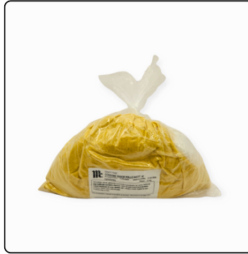
CONSOMÉ SABOR POLLO MC. CORMICK 2 KG. BOLSA