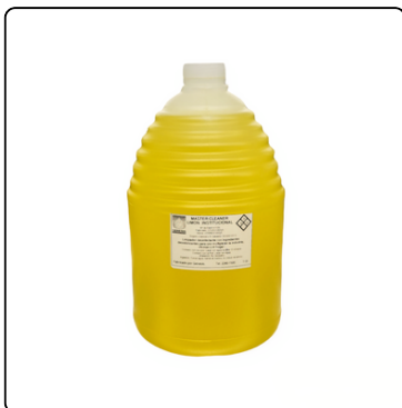
DESINFECTANTE P/PISO LIMON G GENESIS