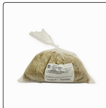
SAZONADOR COMPLETO MC. CORMICK 2KGS BOLSA