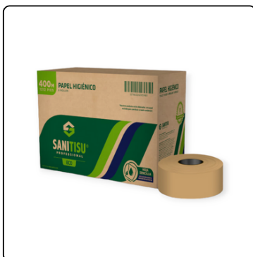
JUMBO ROLL NATURAL SANI TISU 1H 6X400 MT