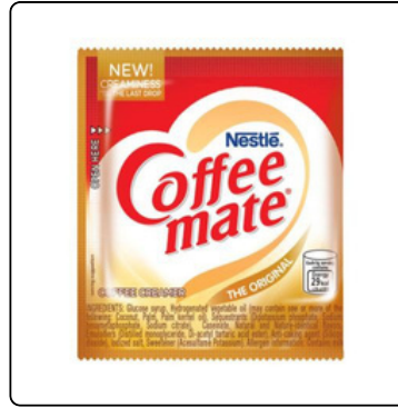
COFFE MATE SOBRE