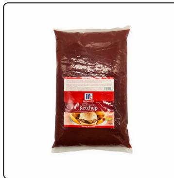
SALSA KETCHUP GL. 4X3.5 KG. MC CORMICK