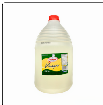
VINAGRE BLANCO GOURMET BOTE 3785 ML