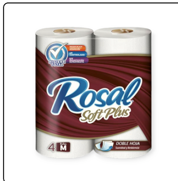
ROSAL VINO TINTO 12X4