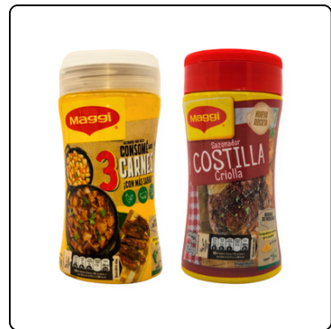
CONSOMÉ 3 CARNES MAGGI 24X260G COSTILLA 24X225G FRASCO