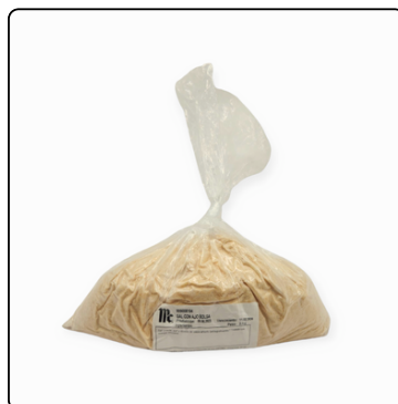
SAL CON AJO MC. CORMICK BOLSA 2 KS