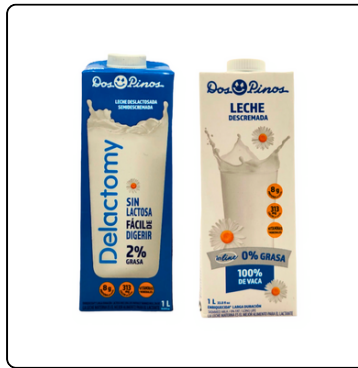
LECHE DESLAC SEMIDESC/DESCREMADA