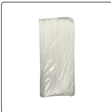
PAJILLAS CON FORRO 1(100X75UN)