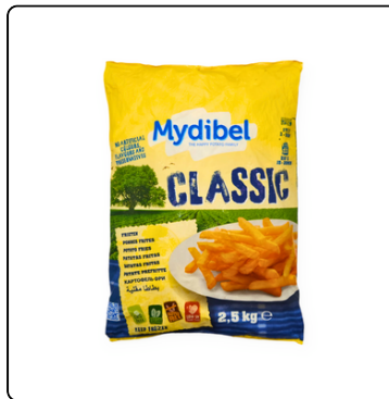
PAPAS FRITAS CLASICAS 9/9 A MYDIBEL 22 LIBRAS