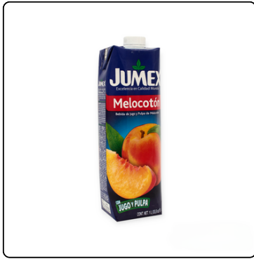
NECTAR DE DURAZNO JUMEX 1 LITRO