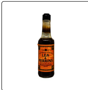
SALSA INGLESA LEA & PERRINS 5 OZ. BOTE