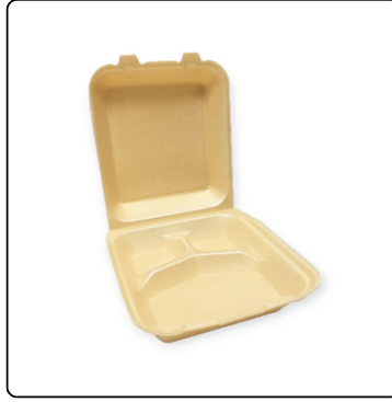
BANDEJA 9X9 TERMO C/DIVISION 1X4X50 UN