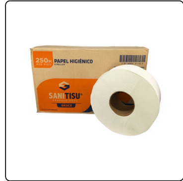
JUMBO ROLL 250M 2P BÁSICO 6X250M