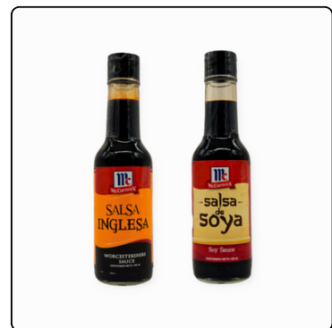
SALSA DE SOYA 5 OZ SALSA INGLESA 24X5 OZ