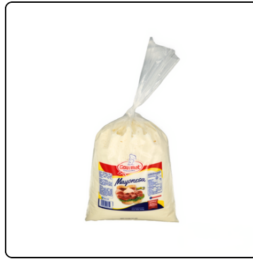
MAYONESA ADEREZO GALÓN BOLSA GOURMET