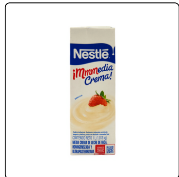
MEDIA CREMA NESTLE 12X1 LITRO