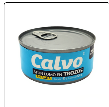
ATUN EN AGUA TROZOS CALVO LATA 120 GRS.