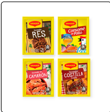
CONSOMÉ DE CAMARÓN POLLO/RES/COSTILLA TIRA 12X10 GRS