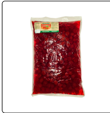
CHERRIES CON TALLO BOLSA 5.5 LBS. FRUTALIA