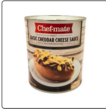
CHEF-MATE BASIC CHEDDAR SCE LAT 6X106 OZ US