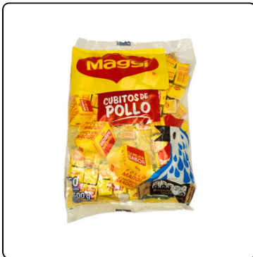
MAGGI CUBITOS DE POLLO 32X150 UN