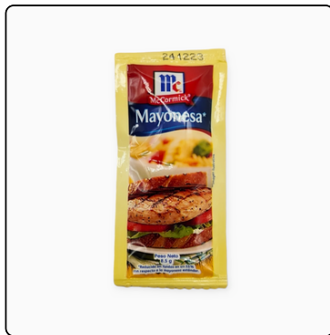
MAYONESA MCCORMICK 900 X9 GRS SOBRES