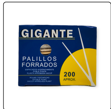
PALILLOS DE DIENTES C/FORRO 12X200 UN