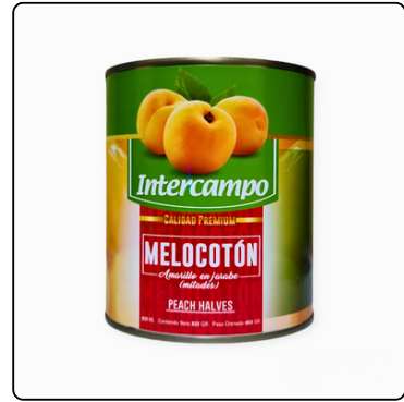
MELOCOTON EN MITADES INTERCAMPO 820G