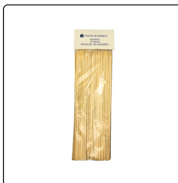
PALILLOS PARA PINCHOS 100 UNIDADES BOLSA