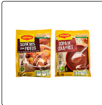
MAGGI COLA DE RES 12X76G SOPA DE RES 55 G.