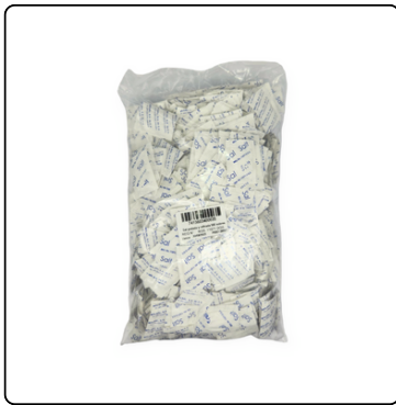
SAL EN SOBRES BOLSA 500 UNIDADES