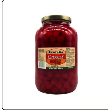
CHERRIES ROJAS S/T FRUTALIA VIDRIO 4256GR