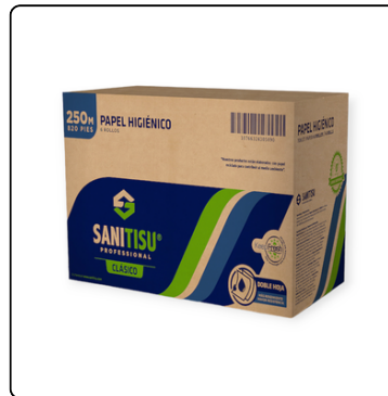
JUMBO ROLL BLANCO 2H SANI TISU 6/250 MTS