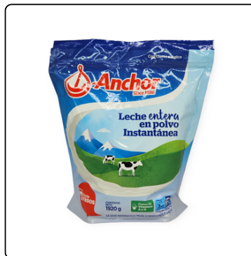
ANCHOR LECHE ENTERA POLVO NZ 8X1.92 KG XP