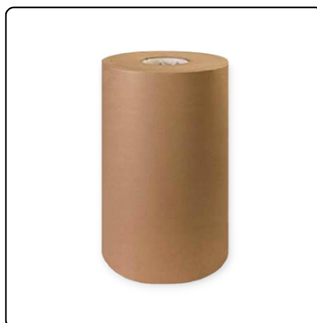
BOBINA MÉDICA 500 MTS