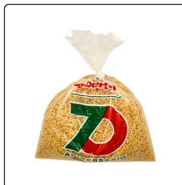
CODITOS BOLSA 6 LBS. ROBERTONI