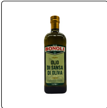
ACEITE DE OLIVA BONOLI 1 LITRO