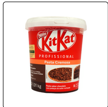
KIT KAT RELLE&COB CHOC NPRO 6X1.01 KG BR