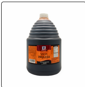
SALSA INGLESA MC. CORMICK GARRAFA 4X3.7 K