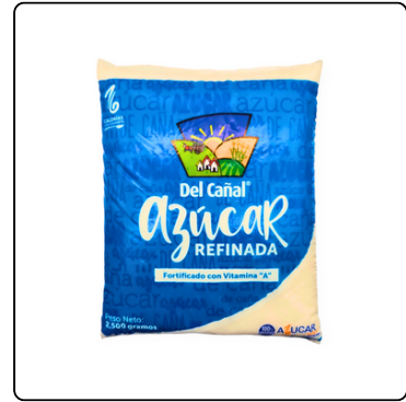
AZÚCAR REFINADA 2.5 KIL