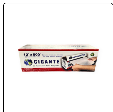
PAPEL ALUMINIO 12X500 GIGANTE