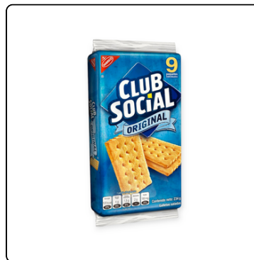
GALLETA SALADA CLUB SOCIAL 24X9X26 G