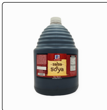
SALSA SOYA MCC GL 4X3.70 MC CORMICK