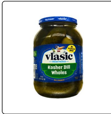
PEPINILLO ENTEROS VLASIC BOTE 46 OZ.