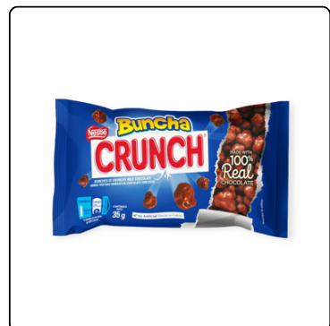
CRUNCH BUNCHA NPRO 4X25 KG P BOLSA