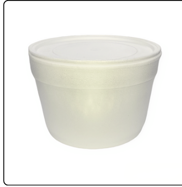
SOPERO 16 OZ. C/TAP. 20/25 UNI.PQT