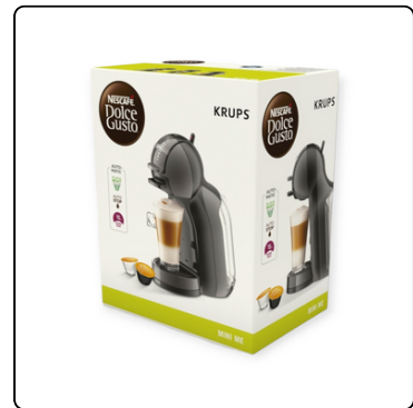
MÁQUINA DE CAFÉ NESCAFÉ DOLCE GUSTO