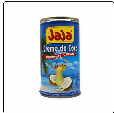
CREMA DE COCO JAJÁ LATA15 OZ (24UNI)