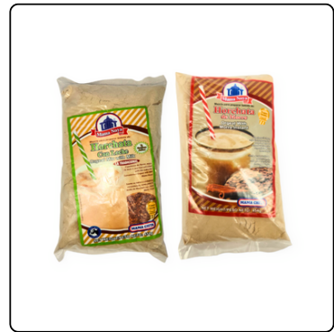
HORCHATA DE MORRO/CON LECHE EN POLVO 1 LIBRA