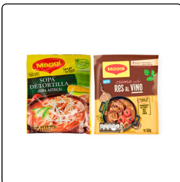
SOPA DE TORTILLA 60GRS CREMA RES AL VINO 50GRS