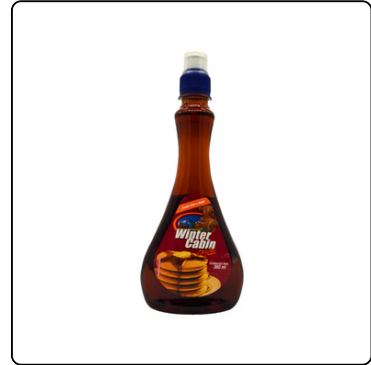
MIEL DE MAPLE WINTER CABIN 360 ML