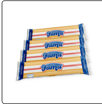
ESPAGUETTY FAMA 15X5 PAQUETES