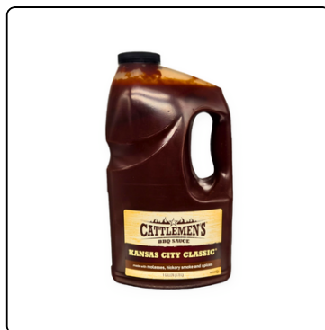
BBQ CATTLEMENS CLASSIC FRENCHS 4X128 OZ