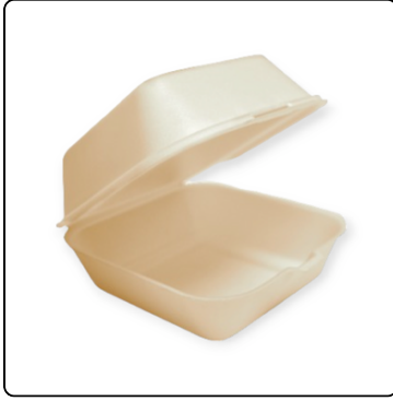
BANDEJA 9X9 TERMO S/DIVISION 1X4X50 UN