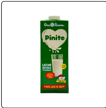
LECHE ENTERA DOS PINOS 3.5% 12X 1 LT