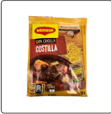
DISPLAY SOPA COSTILLA 12X58 GRS MAGGI