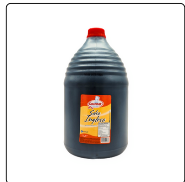
SALSA INGLESA GOURMET GALÓN