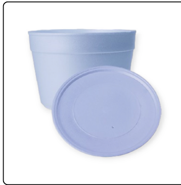
SOPERO 32 OZ C/TAP. 10/25UNI.