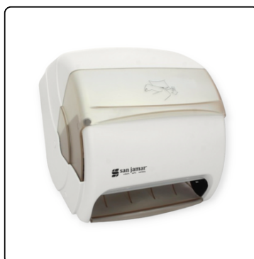
DISPENSADOR BLANCO PARA TOALLA