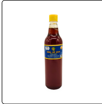
MIEL DE ABEJA BOTELLA 750 ML DE LA FINCA