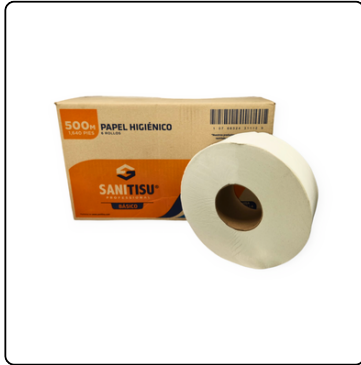
JUMBO ROLL SANI TISU BÁSICO 1H 6X500M