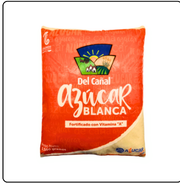
AZÚCAR BLANCA 2.5 KILOS