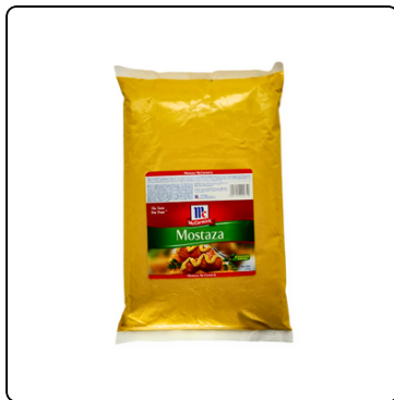
MOSTAZA MC. CORMICK GALÓN BOLSA