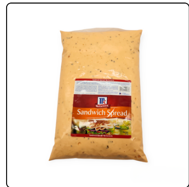
SANDWICH SPREAD MC GLN 4*3.5 KG