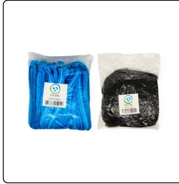
REDECILLA CELESTE/NEGRA PARA CABELLO BOLSA 100