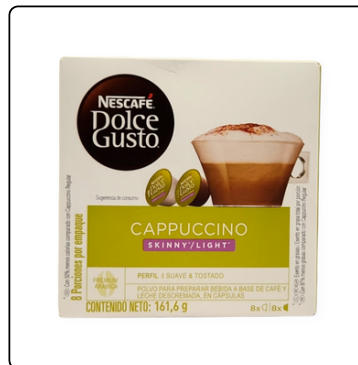
DOLCE GUSTO CAPS 3*186.4G