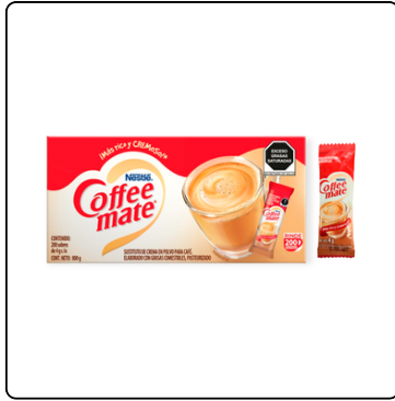
COFFE MATE ORGL 6/200 SOBRES/4 G