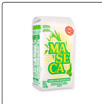
HARINA MAÍZ MASECA BOLSA 50 LBS