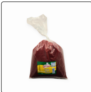
SALSA KETCHUP GOURMET GALÓN BOLSA