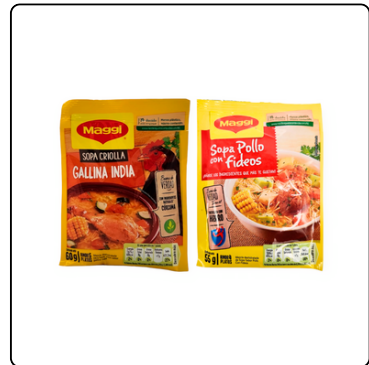
SOPAS POLLO MAGGI 12X55G GALLINA MAGGI 12X60G