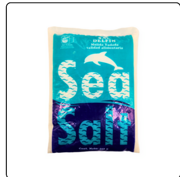
SAL CORRIENTE FARDO 25 LIBRAS