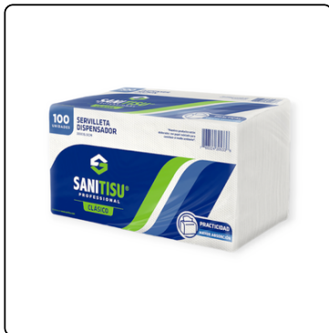
SERVILLETA SANITISU DISPENSADOR 1P 2