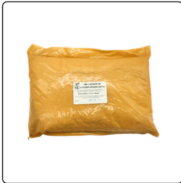
CONSOMÉ DE CAMARÓN ROBERTONI 5 LIBRAS