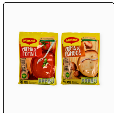
CREMA DE TOMATE 12X76 GRS CREMA HONGOS 66 GRS