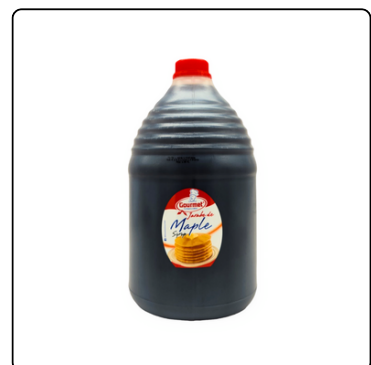
MIEL DE MAPLE GOURMET GALÓN