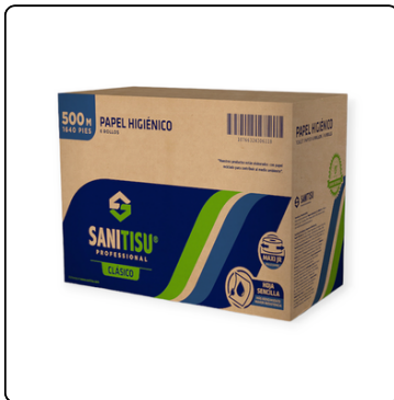
JUMBO ROLL SANI TISU 1H 6X500 MT