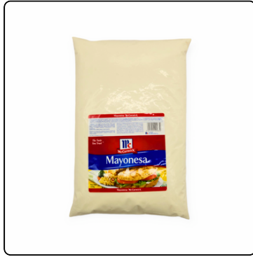
MAYONESA PURA MC. CORMICK GALÓN