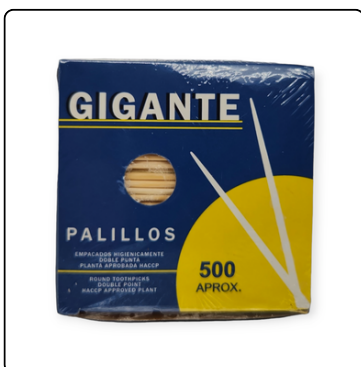
PALILLOS DE DIENTES S/FORRO 24X500 UN