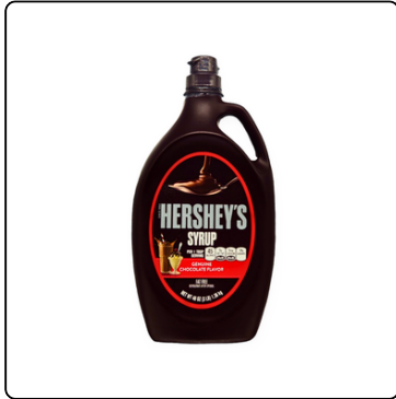
SYRUP DE CHOCOLATE HERSEYS 48 OZ. BOTE