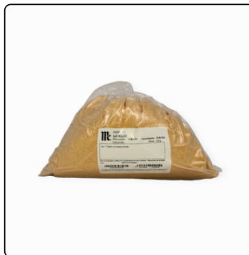
AJO PURO MOLIDO MC.CORMICK 2 KG. BOLSA