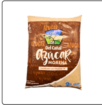
AZÚCAR MORENA BOLSA 2.5 KIL