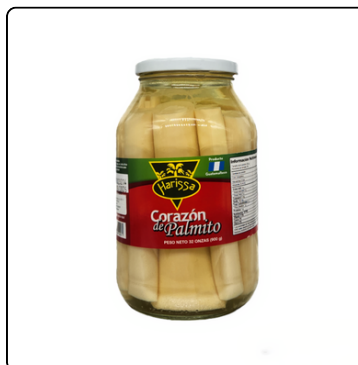
CORAZÓN DE PALMITO 12*32OZ BOTE VIDRIO