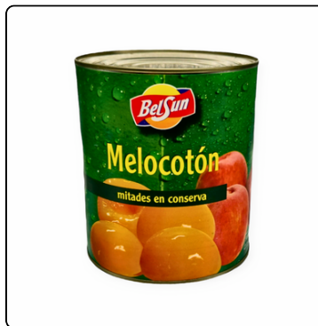
MELOCOTÓN MITADES BELSUN GALON 3000GR.