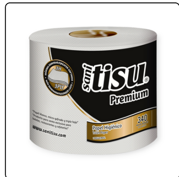
PAPEL HIGIÉNICO SANI TISU ROLLO 340 H 24X1