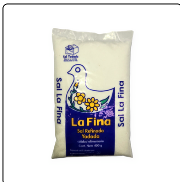
SAL FINA FARDO DE 25 LIBRAS