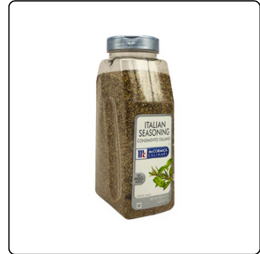
SAZONADOR ESTILO ITALIANO 6X6.25OZ