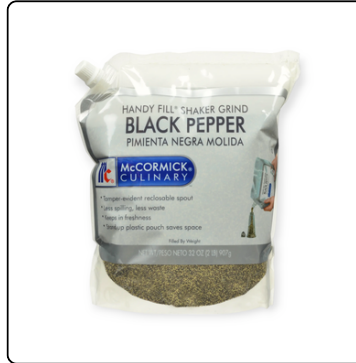
PIMIENTA NEGRA MOLIDA HANDY BOLSA 3X2LIBRAS