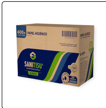
JUMBO ROLL SANI TISU 1H 6X400 MT