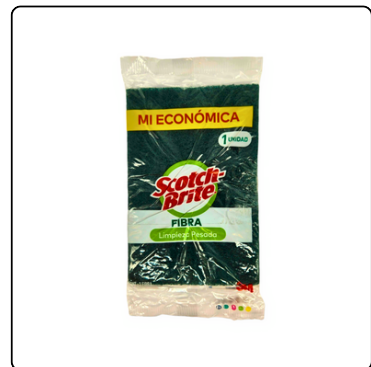
MASCONES VERDES DOCENA