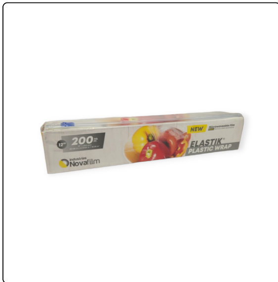
FOOD FILM ELASTIK 12X200 PIES