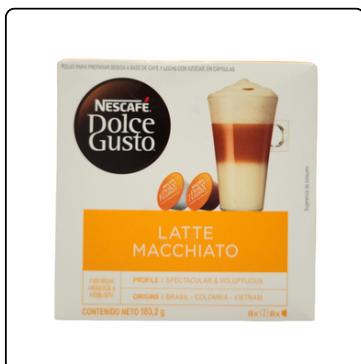
DOLCE GUSTO LT. MAC 16 CAPS 3*183.2G