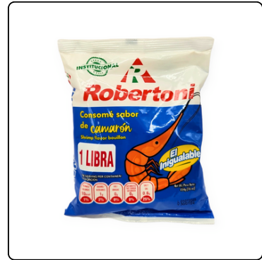
CONSOMÉ DE CAMARÓN ROBERTONI 1 LIBRA