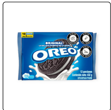
GALLETA OREO CAJA 12 PAQUETES