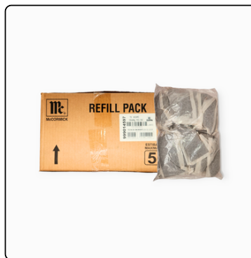
TÉ NEGRO 100X90 GRS CAJA