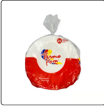
PLATO NO 6 20/25 UNIDADES