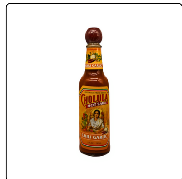
CHOLULA HOT SAUCE CHILI GARLIC