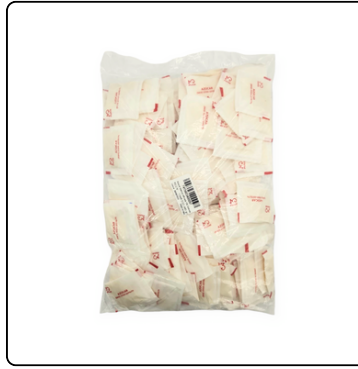
AZÚCAR EN SOBRES BOLSA DE 150 UNIDADES