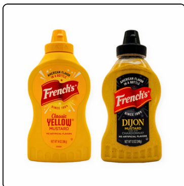
MOSTAZA CHARDONNAY 12X12 OZ SQUEEZE 16*14 OZ.