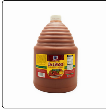
CHILE JALISCO MC. CORMICK GALON