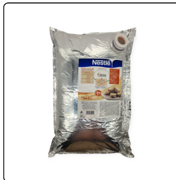
DULCE DE LECHE LA LECHERA 3X6K