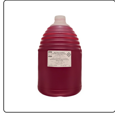
DESINFECTANTE P/PISO CHERRY GLN GÉNESIS