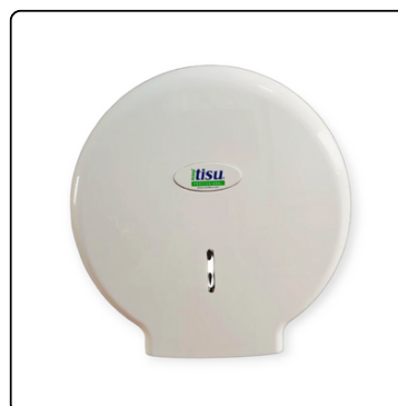
DISPENSADOR JUMBO ROLL SANITISU