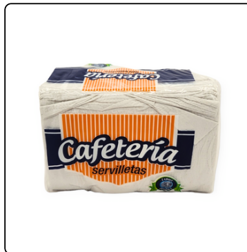
SERVILLETA CUADRADA CAFETERIA DOB 1P 10X1