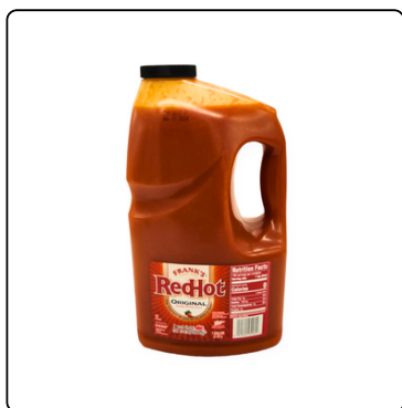
SALSA PICANTE RED HOT GL. 4*128OZ.