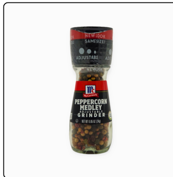
MEZ PIMIENTAS MOLINILLO 6X6X0.85