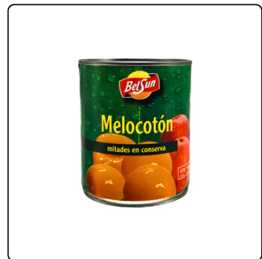
MELOCOTÓN BEL SUN 24X820 GRAMOS ABRE FACIL