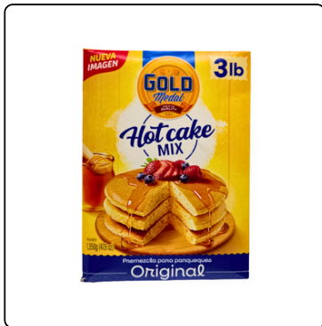
HARINA P/PANCAKE GOLD MEDAL 3 LBS CJA