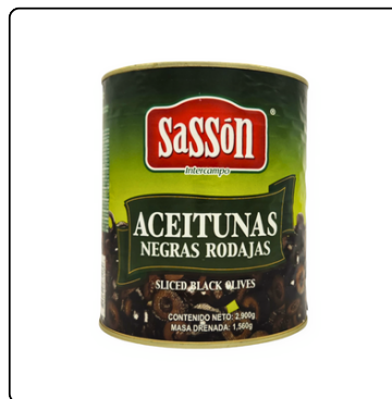
ACEITUNA NEGRA REBANADA SASÓN GALÓN LATA