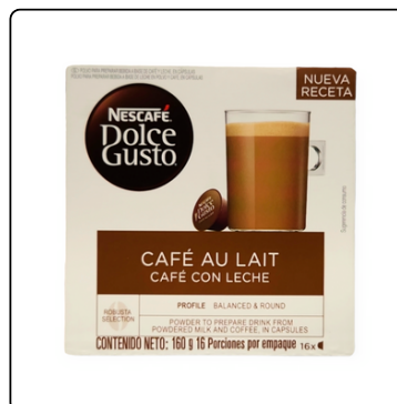
DOLCE GUSTO CAFÉ CON LECHE 16 CAP 3X160