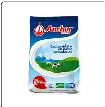
LECHE ANCHOR INSTANTÁNEA 18X350G