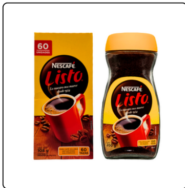
NESCAFÉ LISTO STICK 108G 200G