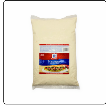
ADEREZO MAYO REDU. LÍPIDOS MC 4*3 KG.