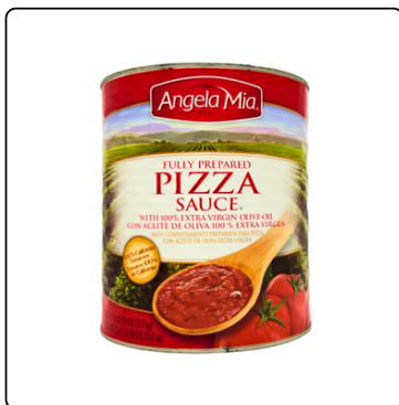
SALSA PARA PIZZA GALÓN LATA ANGELA MIA