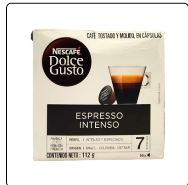
DOLCE GUSTO ESPRES. INT. 3X128 G