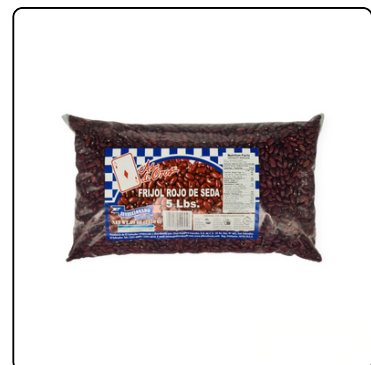
FRIJOL ROJO AS DE OROS 5 LIBRAS