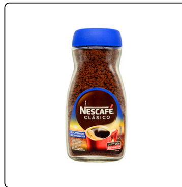
CAFÉ DESCAFEINADO BOTE 120 GRS.