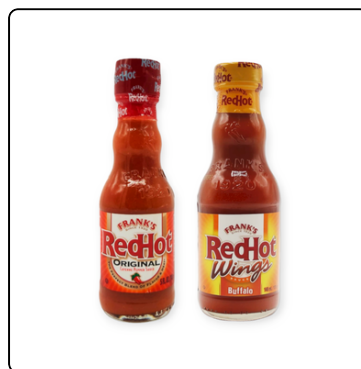
SALSA PICANTE RED HOT ORIGINAL/BUFFALO 24*5 OZ.