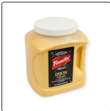
MOSTAZA DIJON CHARDONAY GL 2X105OZ