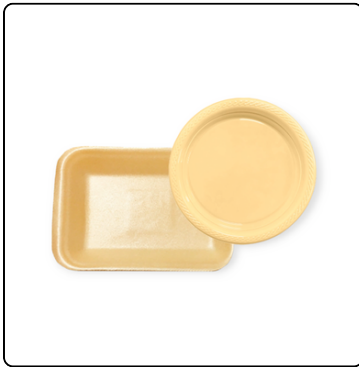
PLATO NO 7 20/25 UNIDADES