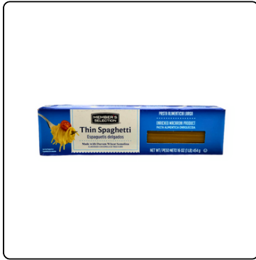
THIN ESPAGUETTI 6/1 LIBRA