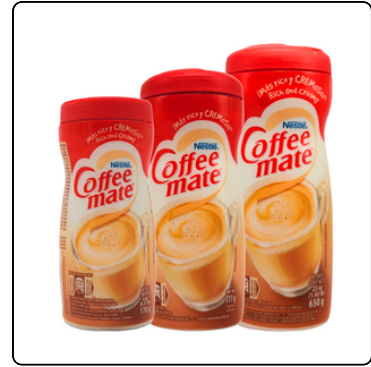
COFFE MATE NESTLE 170G 311G 650G X12