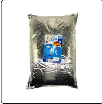
LECHE CONDENSADA LA LECHERA BULK 11 KLG.