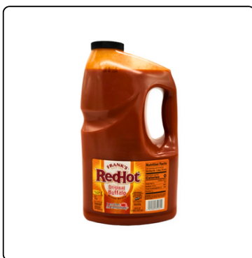
SALSA PICANTE RED HOT. BW 4X128OZ