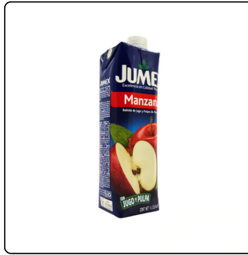
NECTAR DE MANZANA JUMEX 1 LITRO CAJA