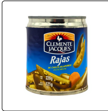
CHILE JALAPEÑO LATA 220 GRAMOS