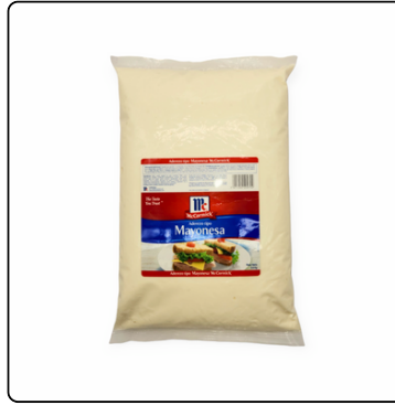
ADEREZO MAYONESA MC. CORMICK 4/3 KG