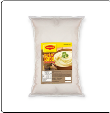
PURÉ DE PAPA MAGGI BOLSA DE 2.3 KG.