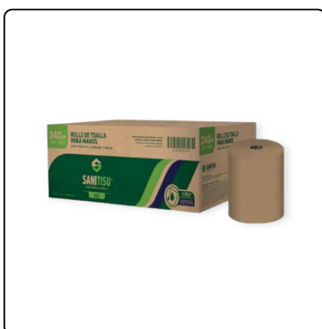
TOALLA P/MANOS NATURAL SANITISU 6X240 MTS.