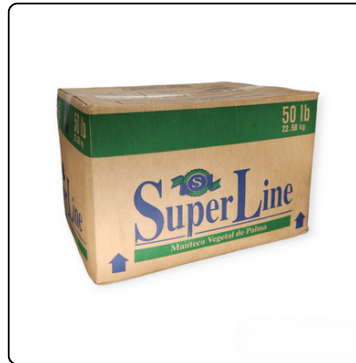
MANTECA SUPERLINE 50LB