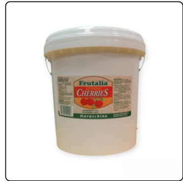
CHERRIES ROJAS FRUTALIA CUBETA 4256GR