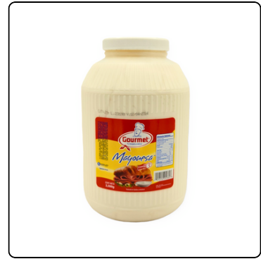
MAYONESA ADEREZO GALÓN BOTE GOURMET