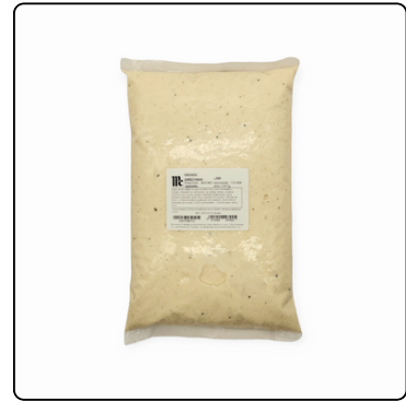
ADEREZO RANCH MC CORMICK 4.3.35 KL