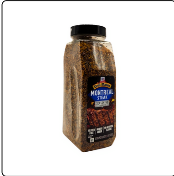
SAZONADOR DE CARNE MONTREAL 6X29OZ