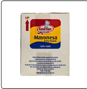
MAYONESA PURA GOURMET VOL PACK GALÓN