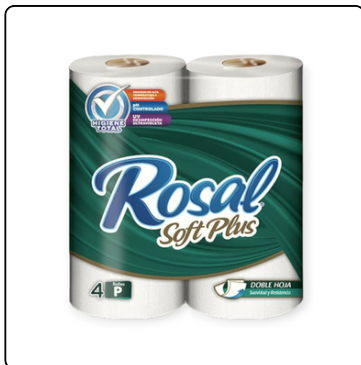
ROSAL VERDE 180 HOJAS DOBLE 12X4 ROLLOS