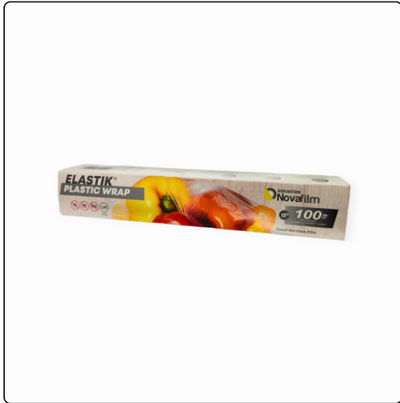
FOOD FILM ELASTIK 12"X1,500 PIES