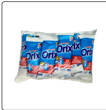
LEJÍA ORIX, POPULINO FARDO 72 UND 200ML