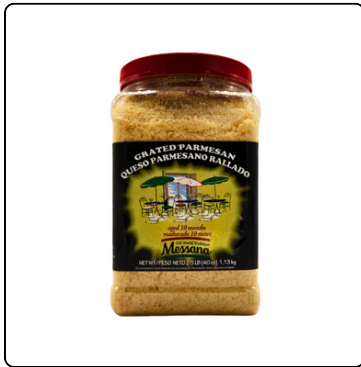
QUESO PARMESANO 2.5 LBS MESSANA