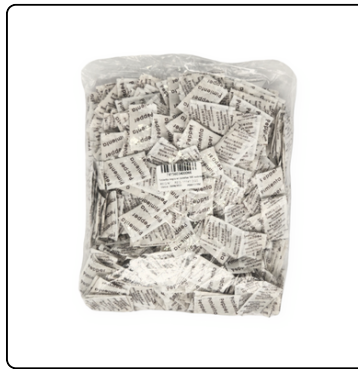
PIMIENTA NEGRA EN SOBRES 500 UN