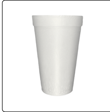
VASO TERMICO 12 OZ. 40/25 1000 UNIDADES