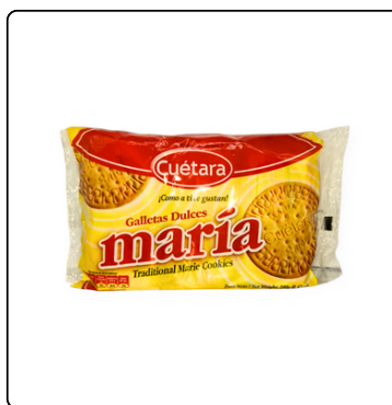
GALLETA MARÍA CUÉTARA 18*12