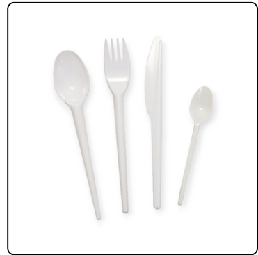
TENEDOR/CUCHILLO/CUCHA RA PQ 25 UNIDADES