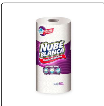
TOALLA COCINA 100H 2P 24X1