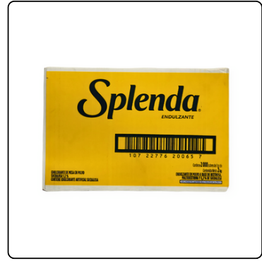
AZÚCAR SPLENDA 2000 SOBRES CAJA