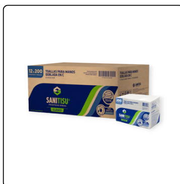
TOALLAS PARA MANOS INTERFOLIADA SANITISU 12*200