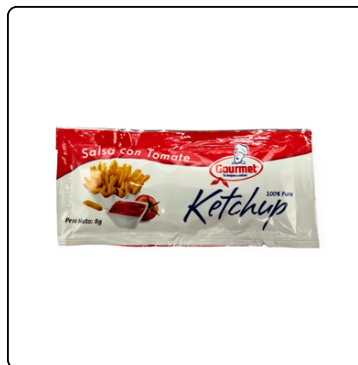
KETCHUP GOURMET PORTION PACK 2X500X8 G