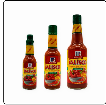
CHILE JALISCO 12X10 OZ 24X5 OZ/ 36X2OZ 60ML