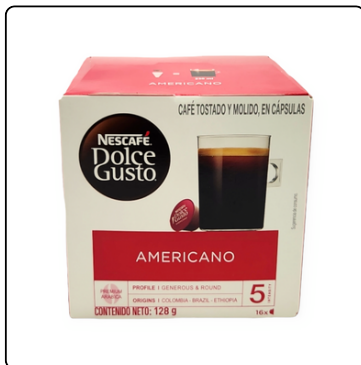
DOLCEGUSTO AMERICANO 16 CAPS 128GRS