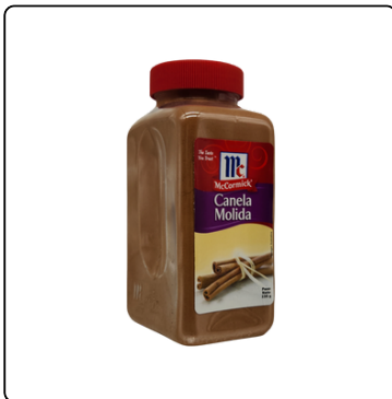
CANELA MOLIDA MC.CORMICK BOTE 235 GRS.