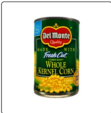
MAÍZ DESGRANADO LATA 15 OZ. DEL MONTE