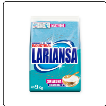
DETERGENTE S/A EN POLVO LARIANZA 33 LB