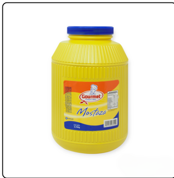
MOSTAZA GOURMET BOTE GALÓN