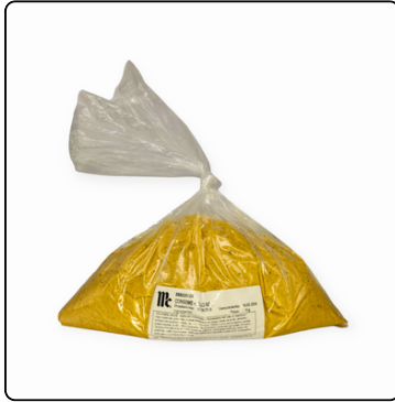
CONSOMÉ DE POLLO MC. CORMICK 2 KG. BOLSA