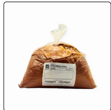
PIMENTON ESPAÑOL /PAPRICKA 2 KL