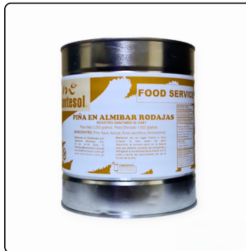
PIÑA EN RODAJAS MONTESOL GALÓN LATA