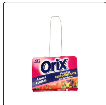
PASTILLA BACTERICIDA PARA BAÑOS 50 GRS.