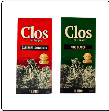
VINO BLANCO/TINTO CLOS DE PIRQUE 1 LT