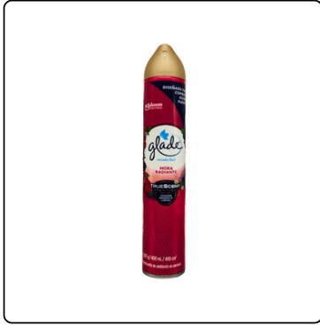
AMBIENTAL GLADE AEROSOL