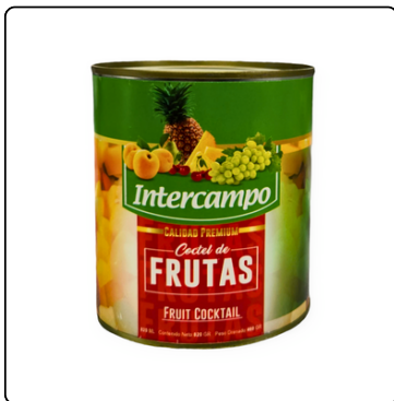
COCTEL DE FRUTAS INTERCAMPO 820G