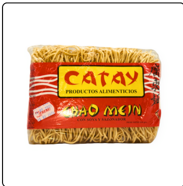
CHAO MEIN (TALLARIN) CATAY 1 LIBRA