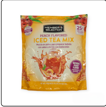
TÉ MELOCOTON 4.4 LIBRAS