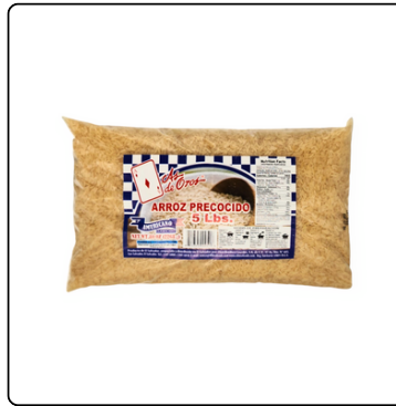
ARROZ PRECOCIDO 5 LBS AS DE ORO