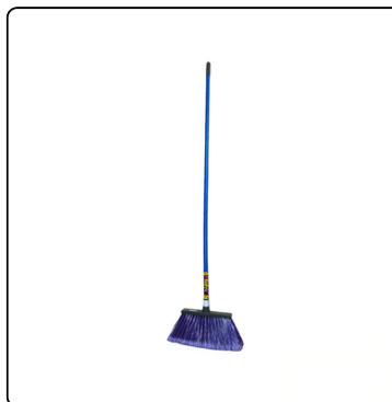
ESCOBA KALY SUPER NENA