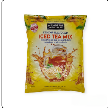
TÉ HELADO SABOR LIMÓN 4X3KG MC.CORMICK