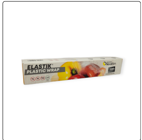
FOOD FILM ELASTIK 12X100 PIES