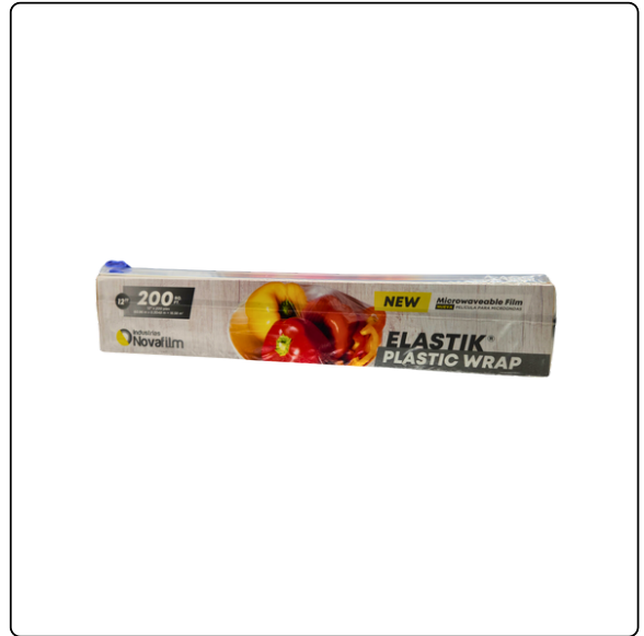
FOOD FILM ELASTIK 18"X1,500 PIES