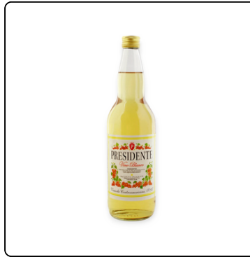
VINO BLANCO PRESIDENTE BOTELLA