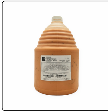
ADEREZO MIL ISLAS GL. MC. CORMICK