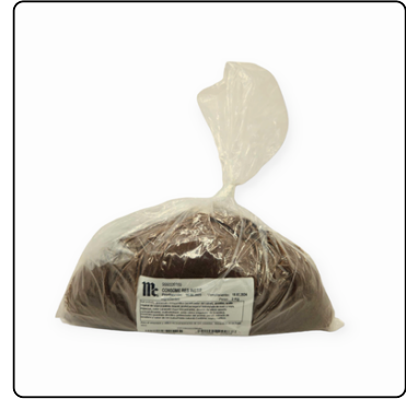
CONSOMÉ DE RES MC.CORMICK 2 KLGS BOLSA