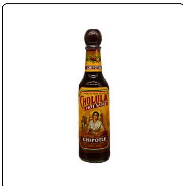
CHOLULA HOT SAUCE CHIPOTLE