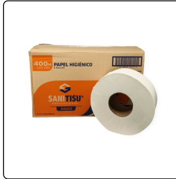
JUMBO ROLL SANI PROF BÁSICO 6/400 MT