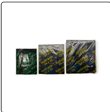
BOLSA NEGRA JARDINERA /MEDIO JARDIN/HIGIENICA