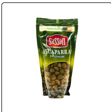
ALCAPARRA SAZÓN BOLSA 24/155 GRS