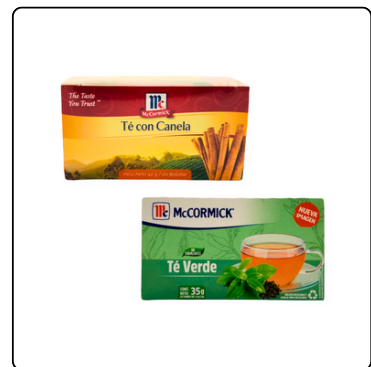
TÉ CON CANELA 1(48X20 UN) TÉ VERDE CAJA 25 SOBRES