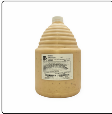
ADEREZO CAESAR MC. CORMICK GARRAFA 4 X 3.8 K