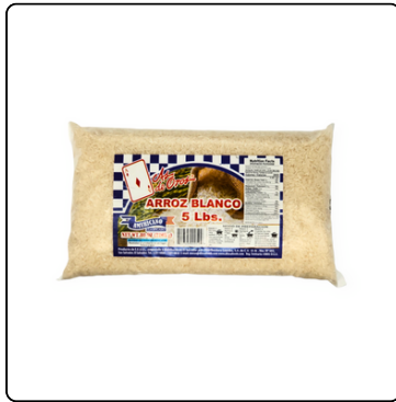
ARROZ BLANCO 5 LBS AS DE OROS