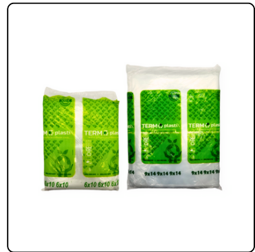
BOLSA TRANSP 2 LBS/5 LBS 500 UN