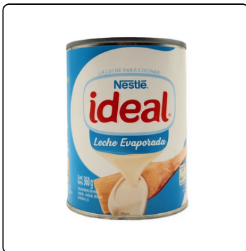
IDEAL LECHE EVAPORADA LATA 48X360 G XP