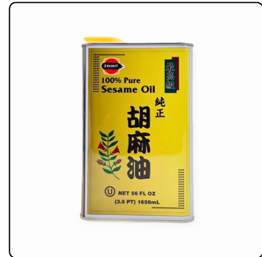
ACEITE DE AJONJOLÍ PURO 1657ML SESAME