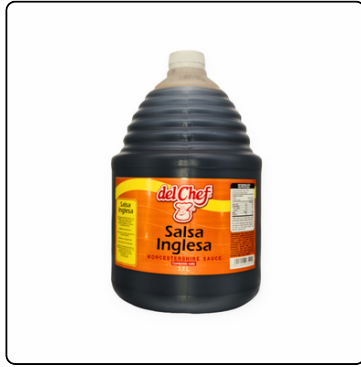
SALSA INGLESA CHEF GARR 4X3.7