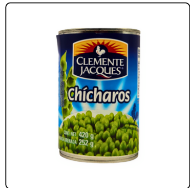
CHÍCHAROS CLEMENTE 420 GRS