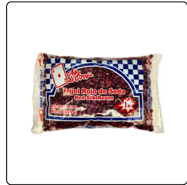
FRIJOL AS DE ORO 1 LIBRA BOLSA