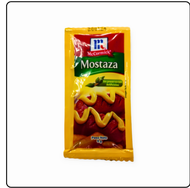
MOSTAZA EN SOBRES MC CORMICK 1000/6 GR