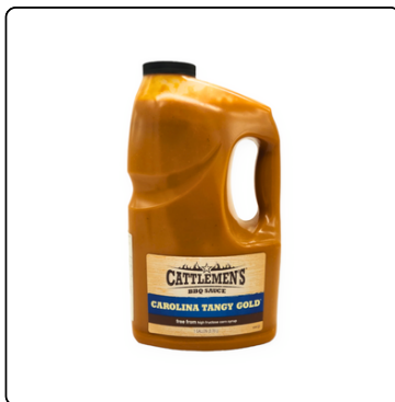
SALSA BBQ CAROLINA TANGY GOLD 12 X18 OZ