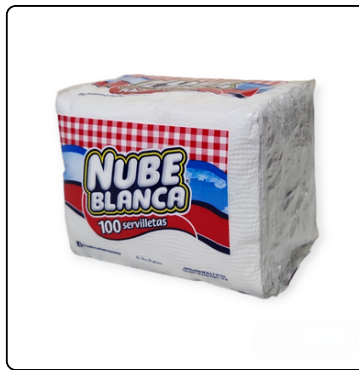
SERVILLETA NUBE BLANCA 1P 10 X 100