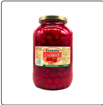
CHERRIES ROJAS C/T FRUTALIA VIDRIO 4256GR