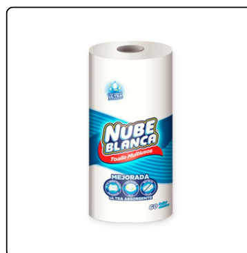
TOALLA COCINA NUBE BLANCA 60H 24X1