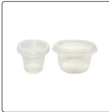
DEPÓSITO 2.5 ONZ/ DEPÓSITO DE 1 ONZ